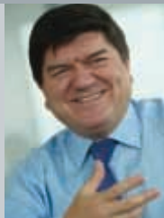
米格爾·洛佩拉 GS1 主席和總裁