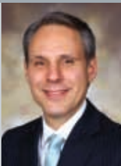
貝思哲 沃爾瑪亞洲區總裁兼首席執行官