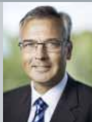
克勞斯·赫明森 馬士基石油鑽探公司執行總裁