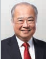
周松崗 香港特別行政區政府經濟發展委員會 航運業工作小組召集人