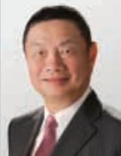
張建東 香港機場管理局主席