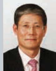
傅育寧 中國招商局集團董事長