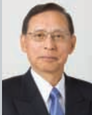
芦田昭充 商船三井代表董事及會長