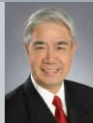
呂榮璋 亞洲付貨人委員會創會主席