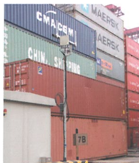
▲ 在關鍵位置增設多跳網絡節點 (node AP)，可提升貨櫃碼頭的網絡覆蓋範圍及傳輸速度。