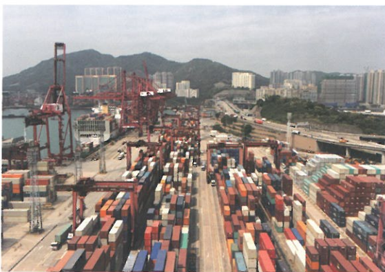
▲ 現時貨櫃碼頭存在很多 Wi-Fi 動態盲點，影響數據傳遞，多跳無線網絡系統可改善這情況。