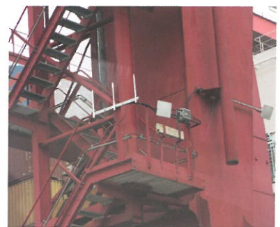
▲ 將接入點 (AP) 安裝在移動的起重機上，可消除 Wi-Fi 盲點，有助提升貨櫃碼頭的運作效率。